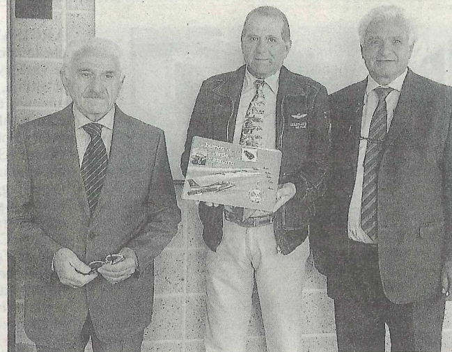
Il libro fotografico è stato presentato ieri dal Club 105 Frece Tricolori

Un libro che ripercorre non una, ma tante storie, e che guarda anche al futuro. Così la presentazione si è trasformata in una chiacchierata collettiva sulla necessità per gli imprenditori italiani di resistere e di fare rete, di creare distretti di eccellenza.